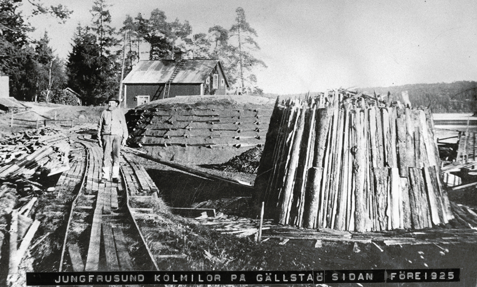
JUNGFRUSUND KOLMILOR PÅ GÄLLSTAÖ SIDAN FÖRE 1925